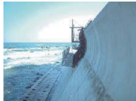
セパレスフォーム 波返し用型枠

日本各地の波返し・擁壁・ピア―・逆T擁壁、・整池・堰堤・堤防嵩上・タンク・ファームポンド・水路共同溝工事の事ならお任せください。 セパレスフォーム （省力化工法）