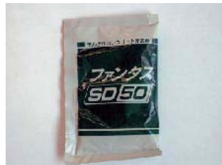
ファンタスSD50 コンクリート添加剤（ファンタスSD）