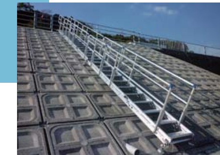
アルミ階段 (アルミ仕様)