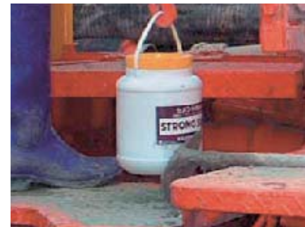
ストロングスーパー（セメント分散剤）