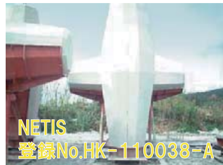
NETIS 登録No.HK-110038-A 剥離剤コート（フォームコート）