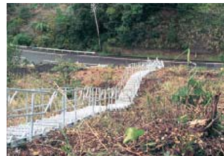
土中用階段 (ドブメッキ仕様)