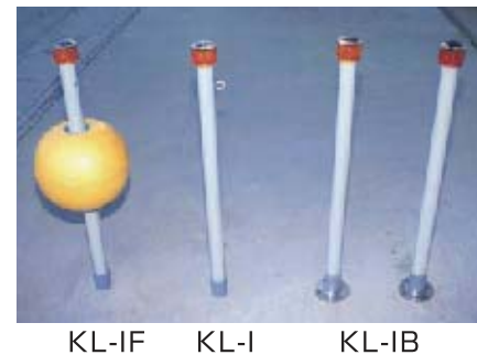
KL-IF KL-I KL-IB 小型標識灯