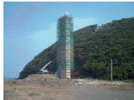
セパレスフォーム ピア―（橋脚）用型枠